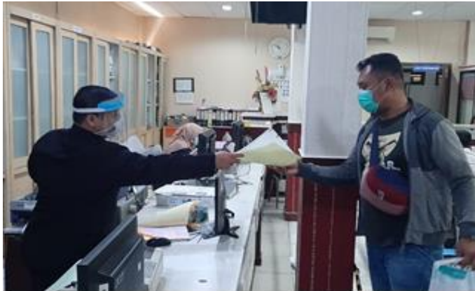
Pelayanan Loker Retribusi Izin Pemakaian Tanah