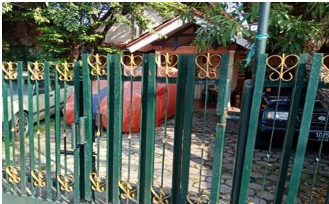
Jl. Karangn No. 234-B