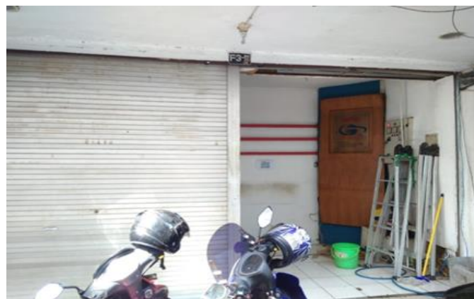
PT Aneka Cipta Total Solusindo Ruko Surya Inti Permata Blok F No 35 Surabaya