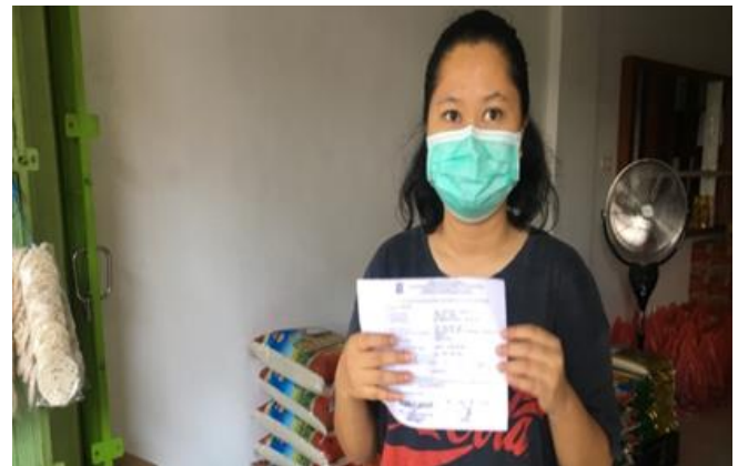
Toko Berkat Abadi Barata Jaya No 12 A