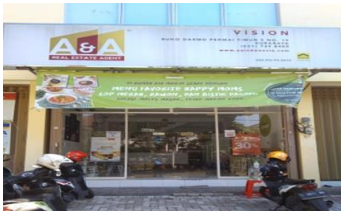
Happy Moms Raya Darmo Permai Timur 19V