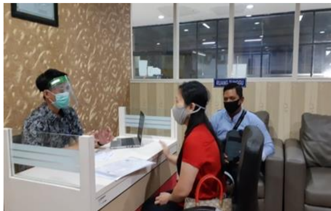
PT Excellence Qualities Yarn

Jumlah Perusahaan yang Diberikan Asistensi Sebanyak 3 Perusahaan