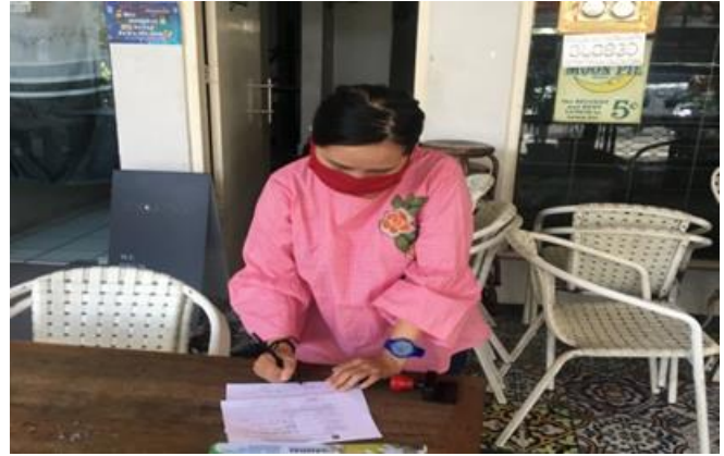
CV Retro Mandiri Ngagel Jaya Barat No. 79