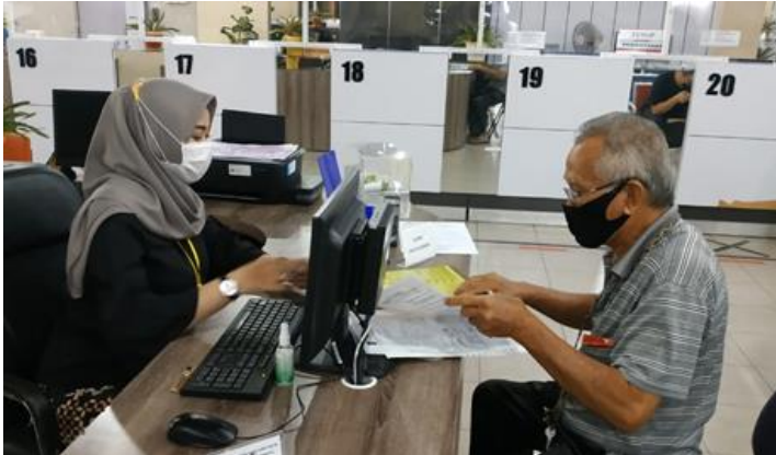
Pelayanan Loker Informasi