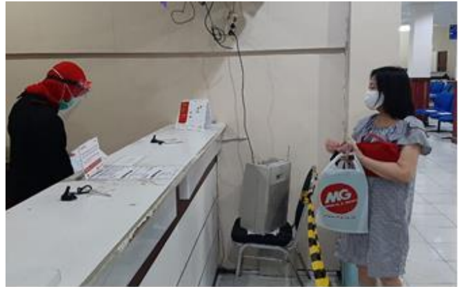
Pelayanan Loker Bank Jatim