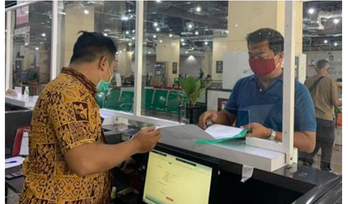
Pelayanan Loker Pengambilan