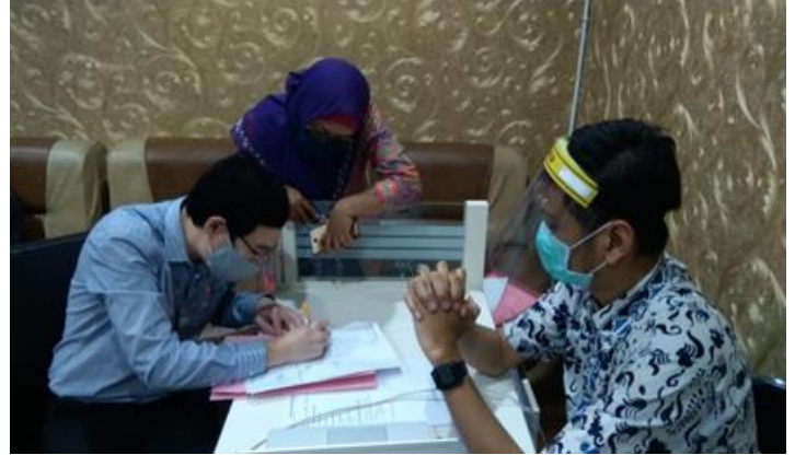
PT Dimensi Iman Hidup