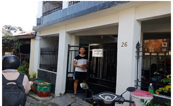
Jl. Karangn III No. 26