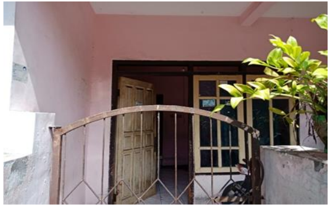
Jl. Gajah Mada Sekolahn No. 21