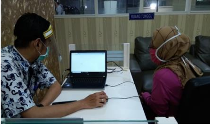
PT Setia Karya Sentosa