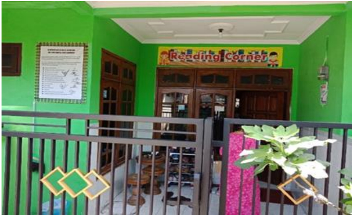
Jl. Karangn Gg. Sekolah RT 4 RW 1