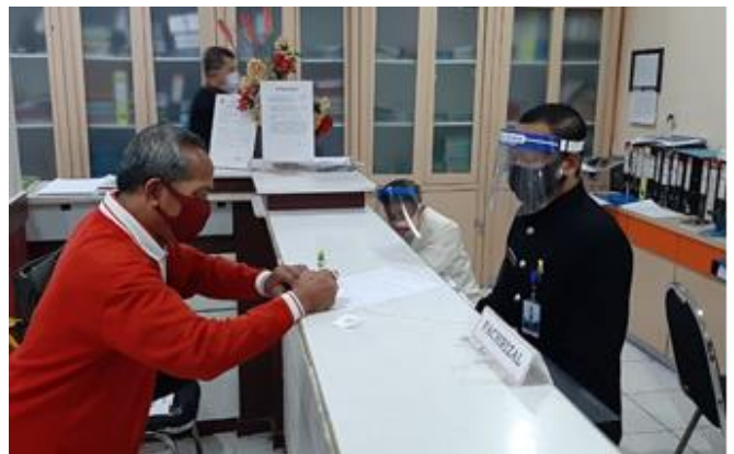
Pelayanan Loker Pengambilan

Jumlah Permohonan Perizinan Yang Masuk Sebanyak 116 Berkas