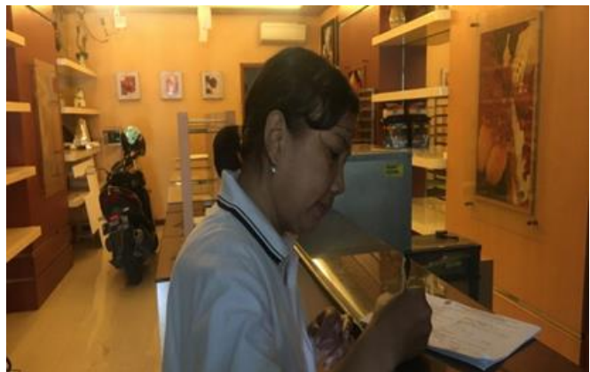
Brown Nice Bakery Ngagel Jaya 21 B