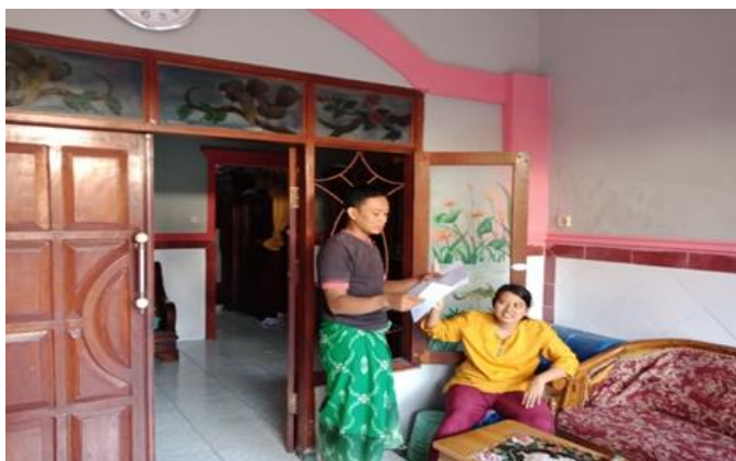
Jl. Karangn III No. 57