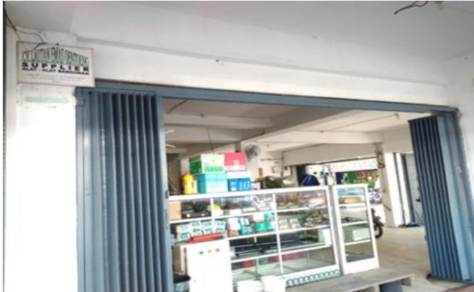
CV Lautan Emas Oentoeng Jl. Darmo Park II Blok III No. 14 Surabaya