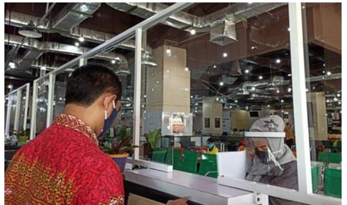
Pelayanan Loker Mandiri

Jumlah Permohonan Perizinan Yang Masuk Sebanyak 125 Berkas