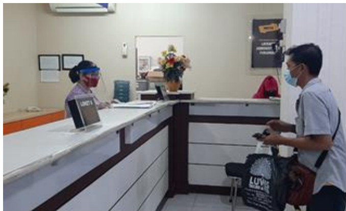
Pelayanan Loker Customer Service