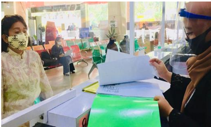
Pelayanan Loker Customer Services