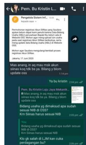
PT Laju Jaya Mekanikal

Jumlah Perusahaan yang Diberikan Asistensi Online Sebanyak 2 Perusahaan